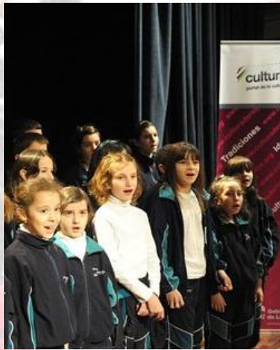
Coro Jorbalán (Logroño)