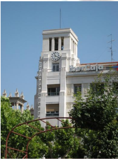
Reloj del Espolón (Logroño)